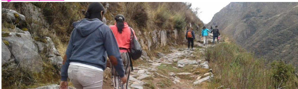
TOUR HUANCAYA – MIRAFLORES 2017 VIAJES Y AVENTURAS 3D/3N con los pioneros y creadores de los circuitos.