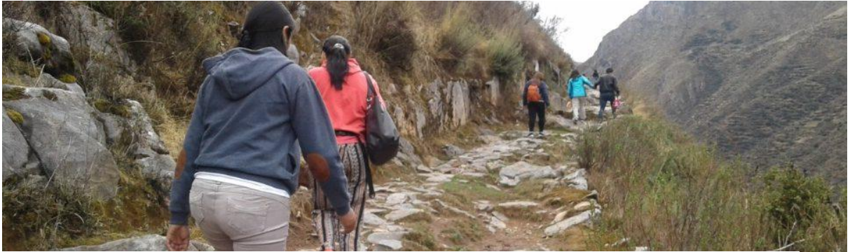
TOUR HUANCAYA – MIRAFLORES 2017 VIAJES Y AVENTURAS 3D/3N con los pioneros y creadores de los circuitos.